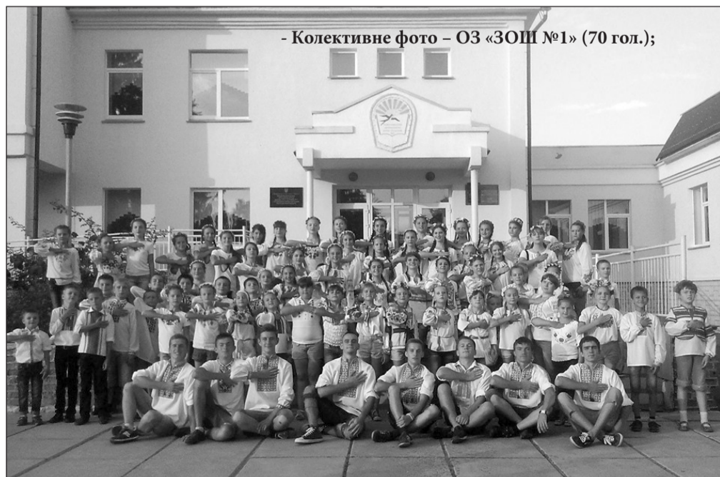
- Колективне фото – ОЗ «ЗОШ №1» (70 гол.);